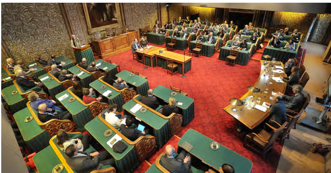
Onderwijsdialoog Een brede kijk op onderwijskwaliteit in het gebouw van de Eerste Kamer

Deze bijeenkomst organiseerde de Onderwijsraad in samenwerking met EP-Nuffic. De bijeenkomst vond plaats op 15 november op het Scheepvaart en Transport College in Rotterdam. Tijdens de bijeenkomst gaf de voorzitter een toelichting op het advies Internationaliseren met ambitie , gevolgd door reacties vanuit de politiek en de gemeente Rotterdam. In het tweede deel presenteerde EP-Nuffic de concept-visie Internationalisering in het primair en voortgezet onderwijs: van ambitie naar actie , waarin zij het onderwijsraadsadvies als uitgangspunt heeft genomen.